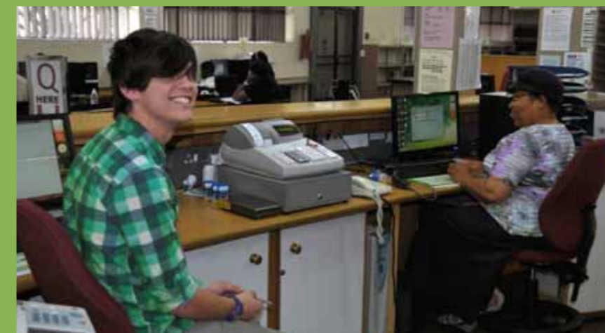
Tydens die oorsigtelike evaluering van die biblioteek op die Vaaldriehoek-kampus.

Die volgende departemente beoog om in 2013 'n oorsigtelike evaluering te doen: