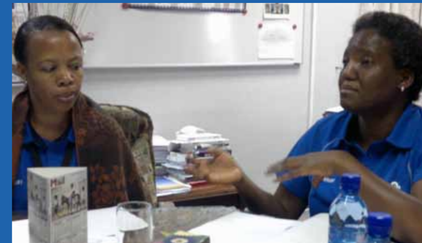
Tydens die oorsigtelike evaluering van die biblioteek op die Mafikengkampus.